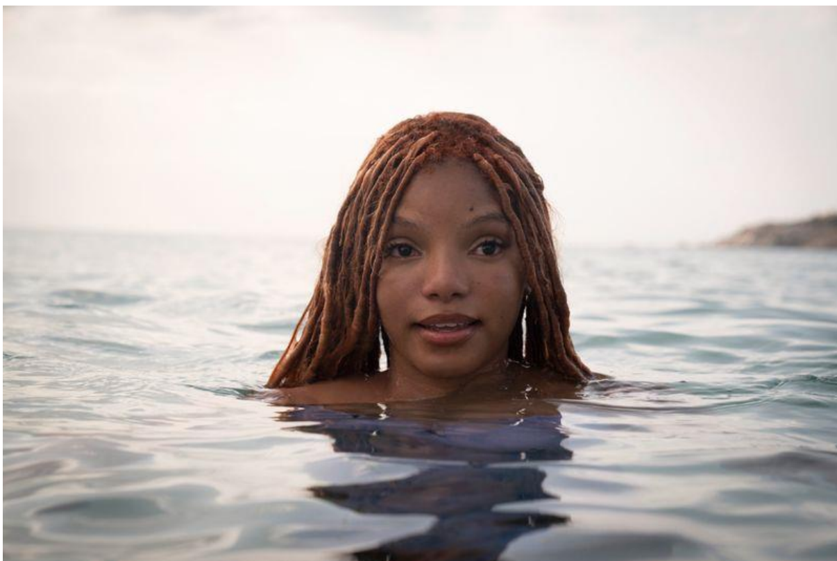
Halle Bailey spiller Ariel i Disneys Den lille havfruen.