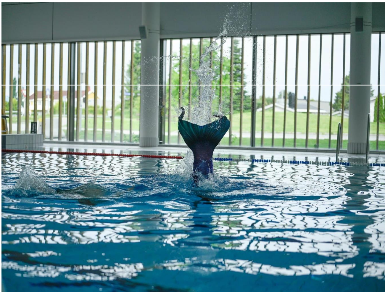
DYKK: Ei havfrue på vei ned i dypet..

- Vi har det artig med å utforske ulike bevegelser innenfor svømming, og samtidig er det sosialt. Vi pleier å være tre stykker, men det kan godt hende det er flere i Verdal som driver med denne hobbyen. Det er plass til flere, sier Granhus.